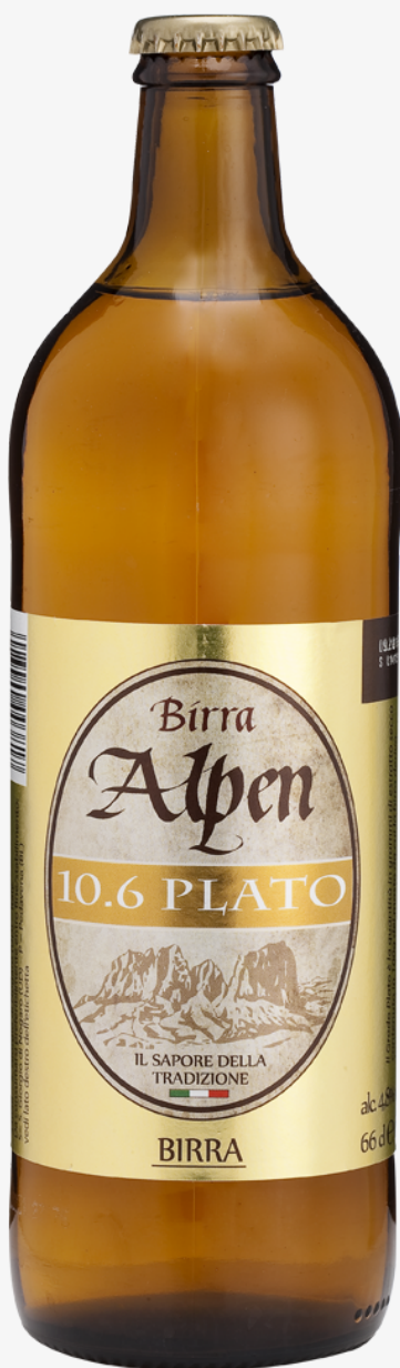
Birra Alpen 10.6 plato 66 cl x 15