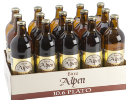
Imballo secondario vassoio Codice EAN 8023400103814