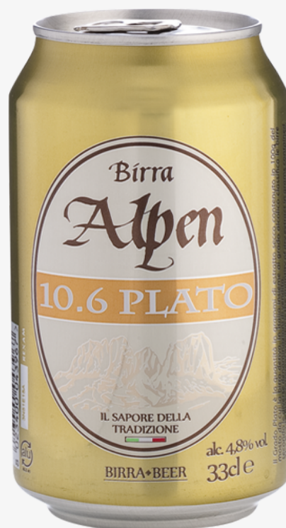
Birra Alpen 10.6 plato 33 cl x 24