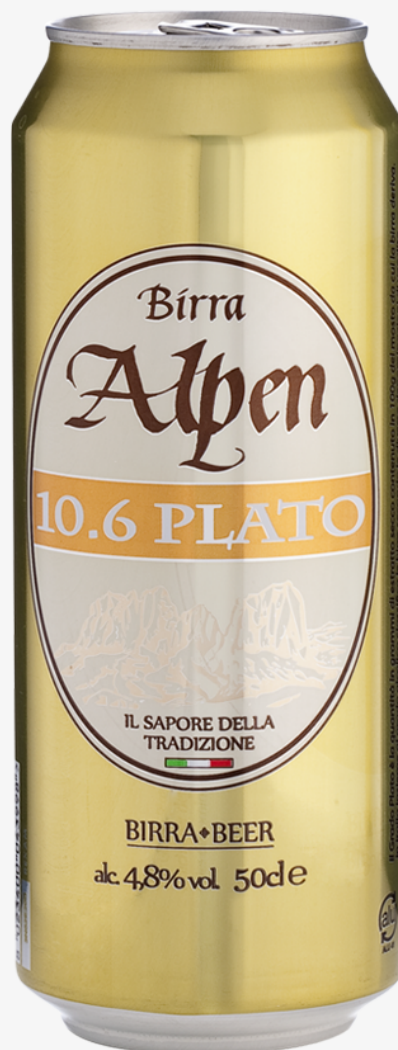
Birra Alpen 10.6 plato 50 cl x 18