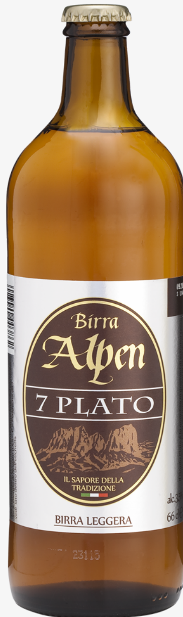
Birra Alpen 7 plato 66 cl x 15