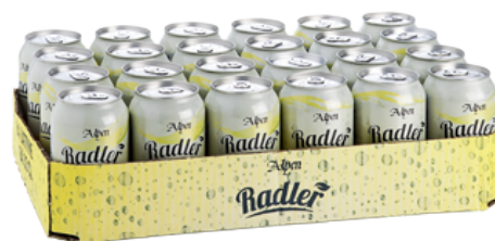
Imballo secondario vassoio Codice EAN n.d.