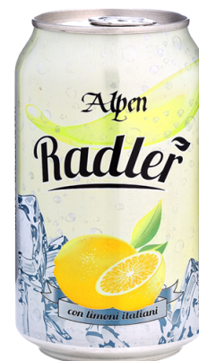
Unità di vendita lattina 33cl Codice EAN 8023400043820