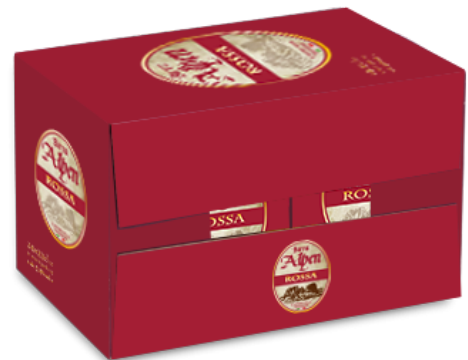
Imballo secondario cartone Codice EAN 8023400103845