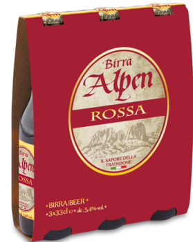
Unità di vendita multipack x 3 Codice EAN 8023400033845