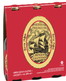
Unità di vendita multipack x 3 Codice EAN 8023400034033