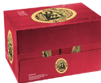
Imballo secondario cartone Codice EAN 8023400104033